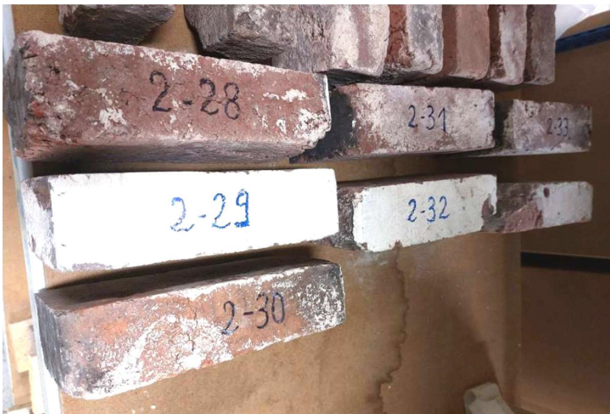
Echantillonnage et marquage en phase de tests laboratoire.