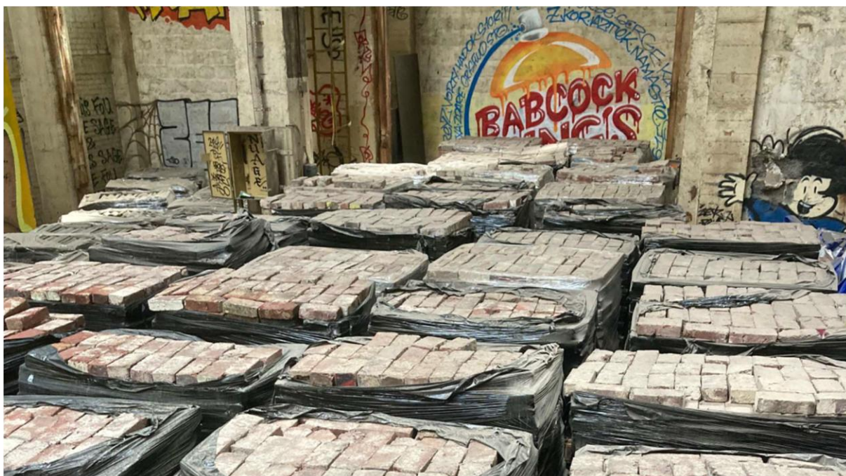
Briques conditionnées sur palettes filmées.

Les briques ont été stockées sur site sur palettes (pour les briques entières et les tuiles) ou dans des big bags (pour les demi briques).